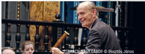
TAKÁCS-NAGY GÁBOR