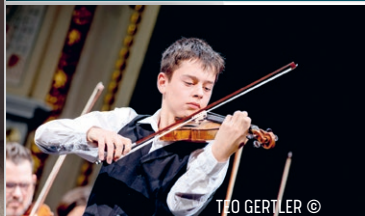
TEO GERTLER ©