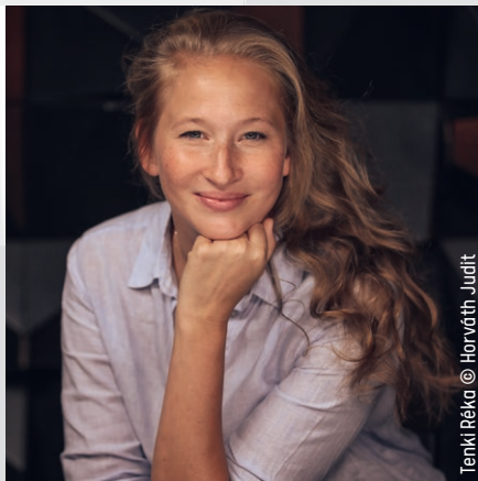
Tenki Réka