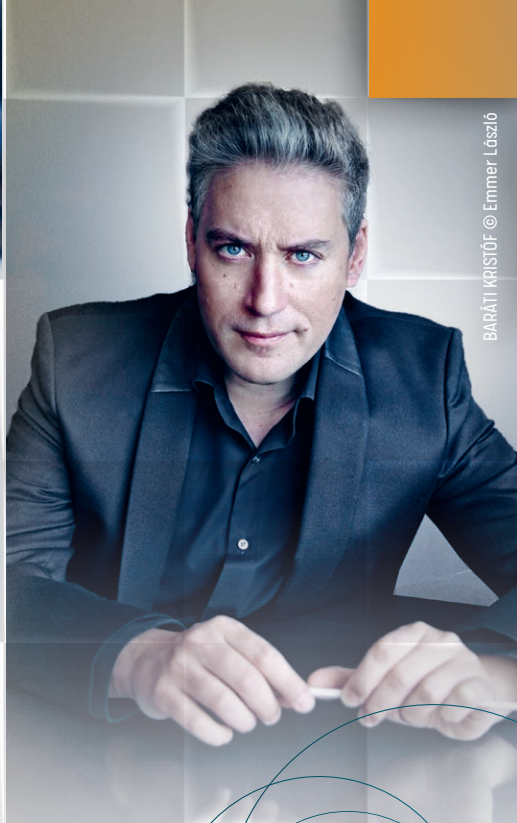
BARÁTI KRISTÓF