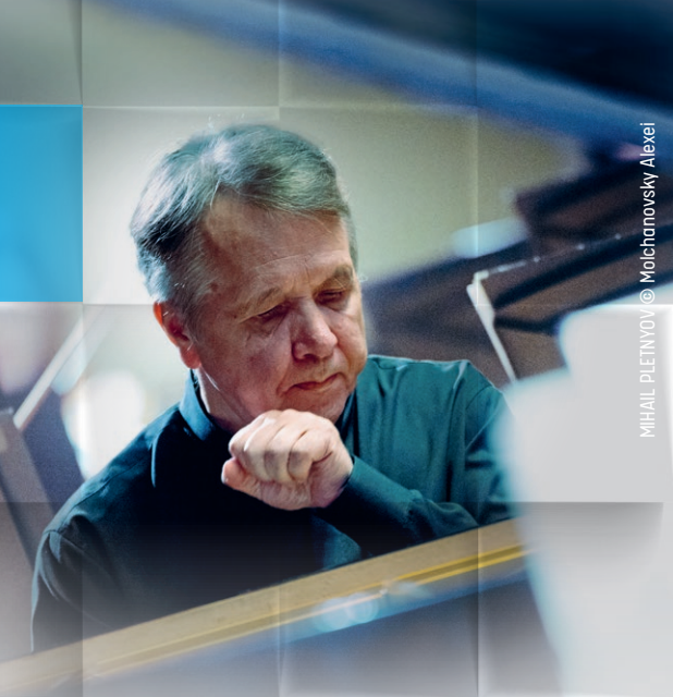
MIHAIL PLETNYOV