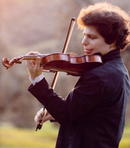
AUGUSTIN HADELICH

Közreműködik: Mácsai Pál , az Őrkény Színház és a Concerto Budapest „INZERT” programorozatának keretében