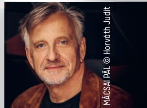
MACSAI PÁL

Jegyárak: 3100, 3900, 4800, 5900, 7500 Ft