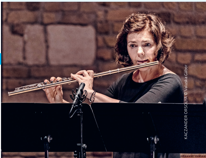
KACZANDER ORSOLYA © Valuska Gábor