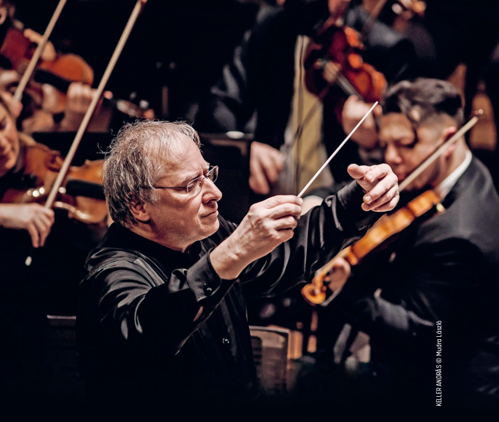
KELLER ANDRÁS

A VI. brandenburgi verseny mindössze fertály órányi hosszú. Míg a versenyszorozat többi darabja, az I. és a II. az olasz concerto grosso mintájára íródott, a legnépszerűbb III.-ban a vonósok dominálnak, a IV. és az V. pedig a szóló hangszereket – első ízben a csemballót – privilegizálja, ez, a sorrendben utolsó darab a régi konzortzene mintáját követi az azonos csoportba tartozó hangszerek megszólaltatásával. Ám ami igazán különlegessé teszi ezt a versenyművet, az a hangszerválasztás. Abban az időben az újabb hegedűcsalád – amelyhez a cselló és a viola da braccio tartozott – került előtérbe: a vezető hangú hegedű helyett a két trióból álló zenekar mélyebb hangú hangszerei miatt sötétebb is az összkép. Az első tételben a két brácsa kánonban játszik, a lassú tételben melankolikus kamarazene szól. A fináléban a nyitótétel szólórészletei térnek vissza és a táncra hívó vidám hangokat hallva pedig sajnálkozunk, hogy velünk ellentétben a brandenburgi közönségnek ez a csoda nem adatott meg.