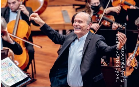
TAKÁCS-NAGY GÁBOR