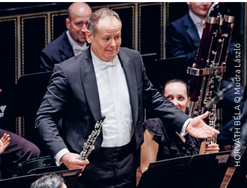
HORVÁTH BÉLA © Mudra László