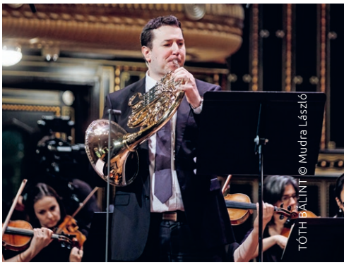
TÓTH BÁLINT