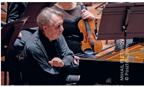
MIHAIL PLETINOV