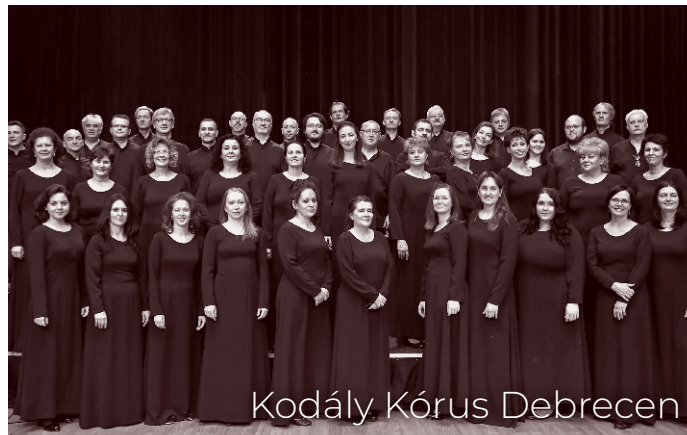
Kodály Kórus Debrecen