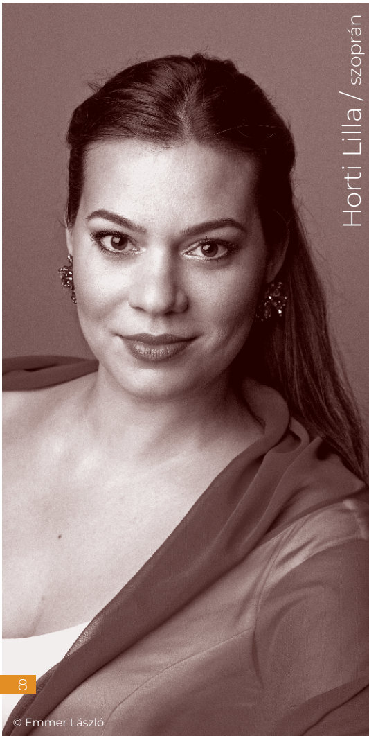
Horti Lilla / szoprán