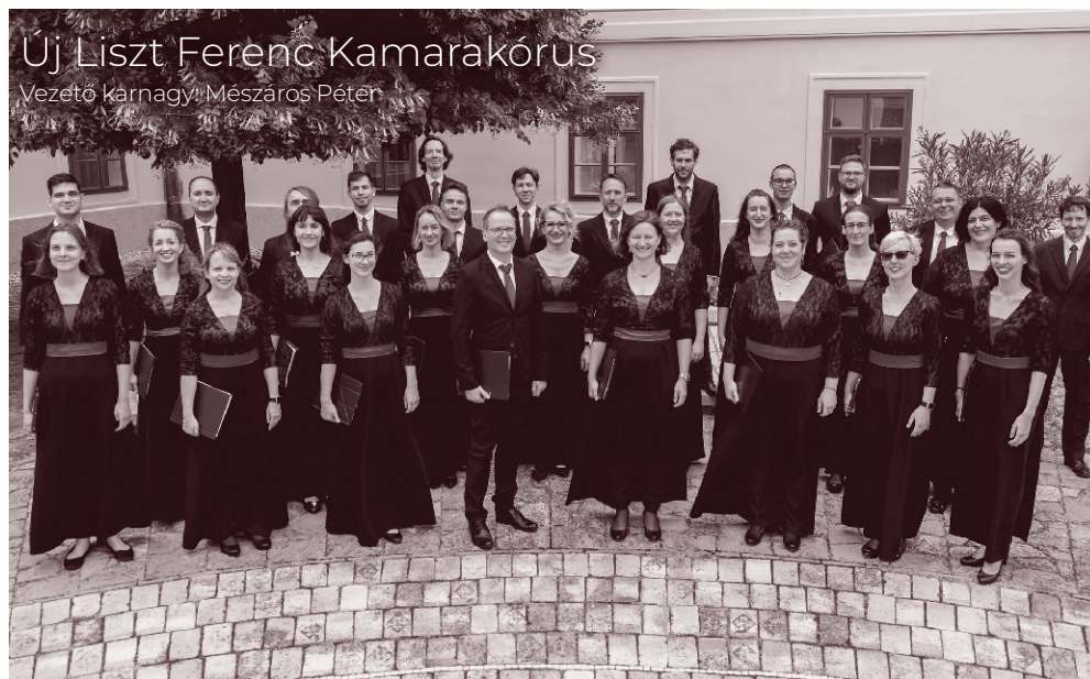
Uj Liszt Ferenc Kamarakórus